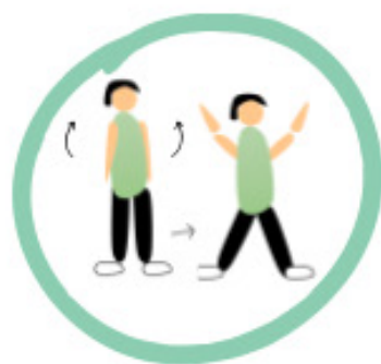
Jumping Jack *