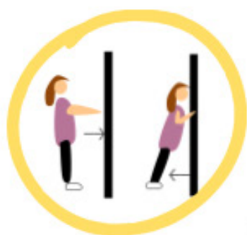
Pompes murales ou sur genoux